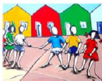
CABO DE GUERRA