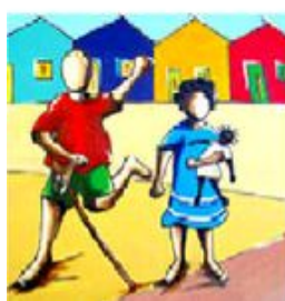
CAVALO DE PAÚ