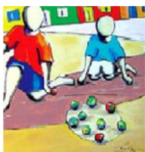
BOLA DE GUDE

-No final haverá uma breve mensagem de despedida.